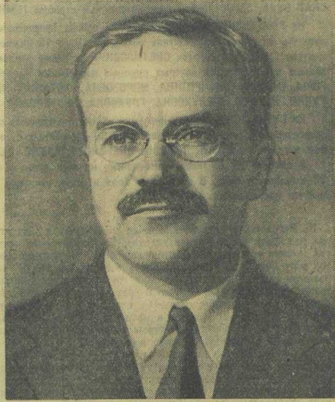
Герой Социалистического Труда В. М. Молотов